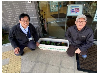
(医)玄真堂 川罵整形外科病院