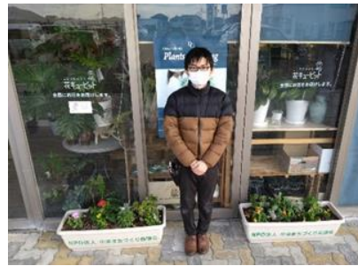
フラワーショップいしばし