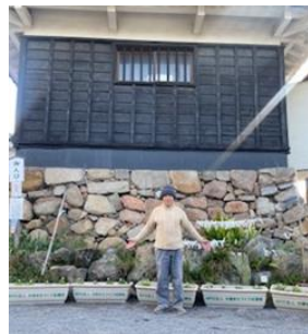
(株)千雅商事 中津城