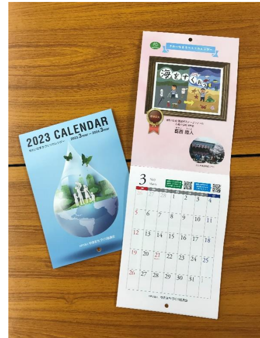
きれいなまちづくりカレンダー

今年度の環境ポスターコンクール受賞作品を掲載した令和5年度のカレンダーを作成し、中津市内の小学生全員に配付し、家庭に持ち帰ってもらい家族ぐるみで環境を考える取り組みを行った。