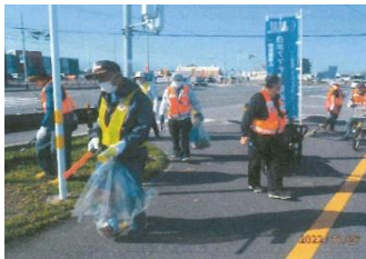
中津アマチュア無線クラブ 赤十字奉仕団