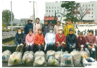
中津地区地域 婦人団体連合会