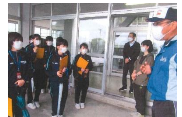
本耶馬溪町観光 ボランティアガイドの会