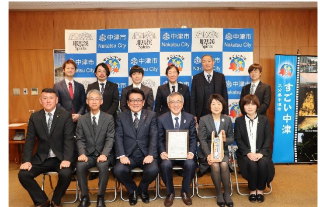
「福澤先生を忘れない」本寄贈式 令和5年3月6日 中津市役所4階応接室

2024年に壺万円札の肖像画が福澤諭吉から 渋沢栄一に変わる事をきっかけに、いつまでも 福澤先生の偉大な功績を忘れないように、次世 代を担う小学生を対象に、本を市内21の小学校 に寄贈し中津を代表する偉人、福澤先生を知っ てもらおう取組みを行った。