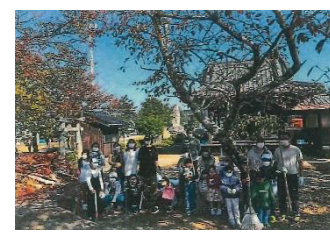
金手沖代子ども会