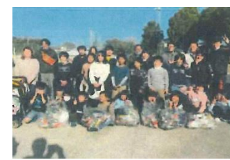
和田小学校父親部会