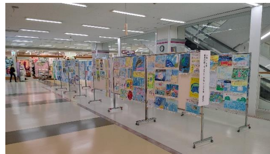
展示の様子(ゆめタウン中津 2階パブリック)