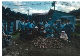
下曾木いこいの家の会