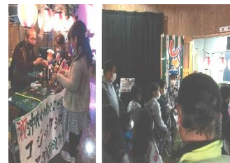
沖代わくわくこども祭り 実行委員会