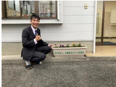
ふく社会保険労務士事務所 大分・福岡オフィス