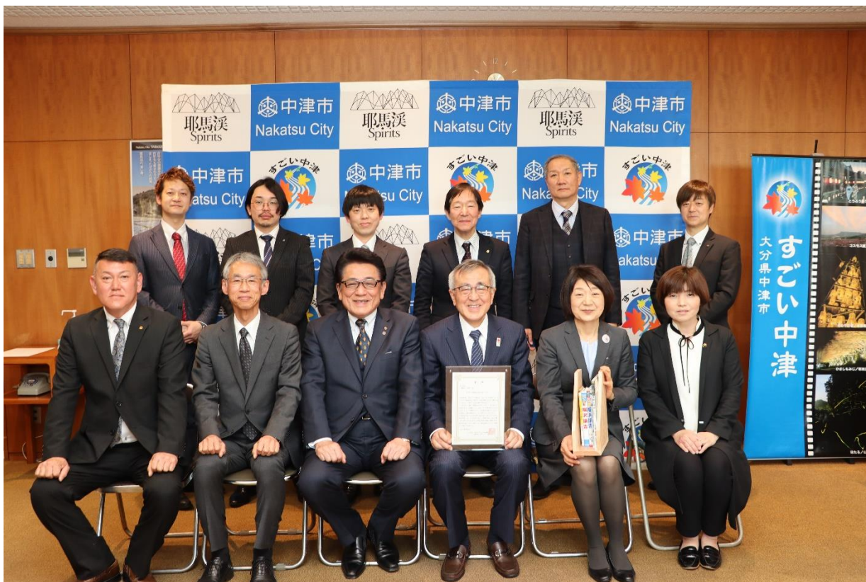
写真／「福澤先生を忘れない」本寄贈式