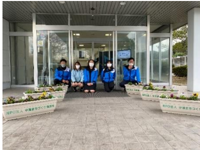
マレリ九州(株)中津工場

景観や環境の改善、緑化、明るいまちづくりの一環として、NPO法人中津まちづくり協議会の希望された会員さんに、事業所内にプランターを設置して頂き、事業所からきれいなまちづくりの輪を拡げて行こうと「花いっぱい運動」の取り組みを行った。