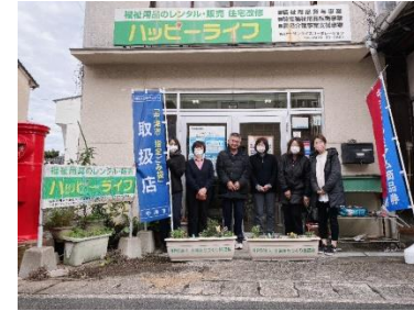
(株)サンライズコーポレーション