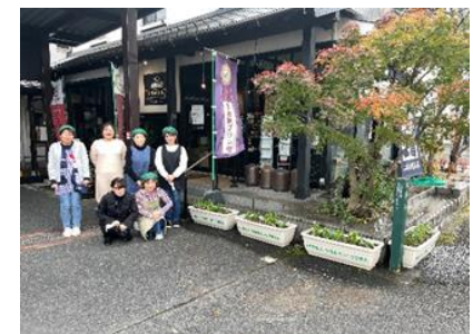
(有)二反田醤油店中津工場